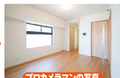
プロカメラマンの写真