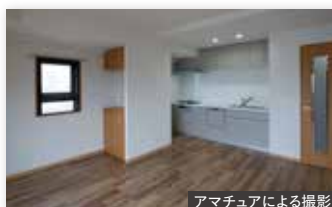
アマチュアによる撮影