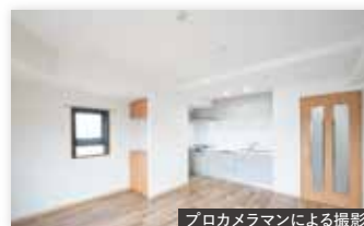
プロカメラマンによる撮影