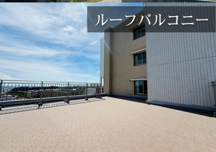
ルーフバルコニー